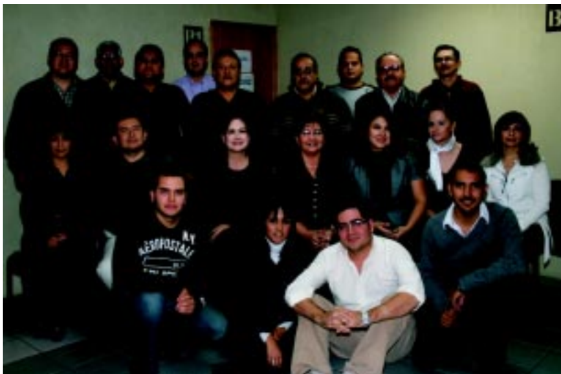
Grupo que inició el día 11 de diciembre: