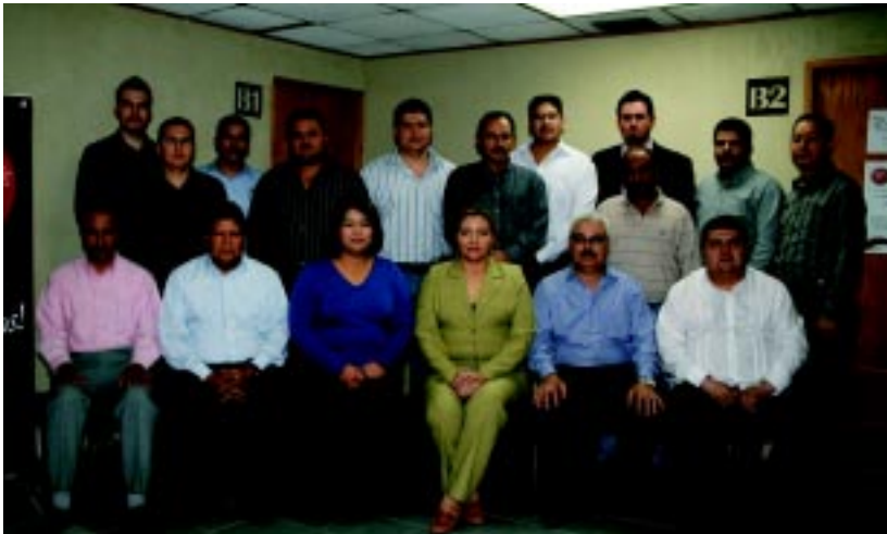
Grupo que inició el 4 de diciembre:

La Maestría tiene como objetivo formar profesionales del más alto nivel en materia de juicio oral y los cursos respectivos son impartidos por prestigiados juristas mexicanos y del extranjero.